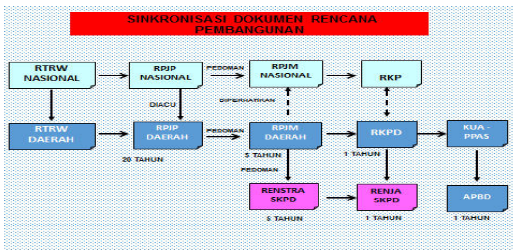
Gambar 1.1 Bagan Alur Keterkaitan Dokumen Perencanaan

Bagan di atas menunjukkan alur penyusunan Rancangan Perubahan Renja Kecamatan Dawarblandong yang berpedoman pada RKPD Perubahan Kabupaten Mojokerto dan kemudian menjadi pedoman penyusunan RKA Perubahan Kecamatan Dawarblandong.